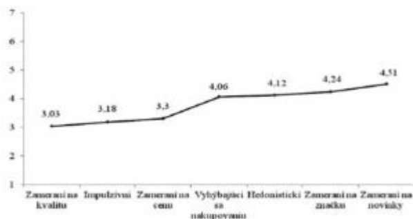
Graf 1: Priemerné hodnoty nákupných štýlov

Na základe výsledkov faktorovej analýzy a po overení reliability konštrukcie nákupných štýlov, vzniklo sedem nákupných štýlov, ktoré boli vytvorené dvadsiatimi šiestimi tvrdeniami. Pre zistenie toho, ktorý nákupný štýl je typický pre mladých ľudí, sa vypočítali priemery za každý nákupný štýl (Graf 1).