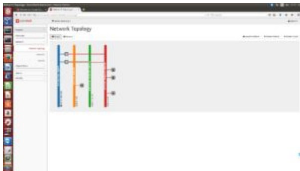
Obrázok 4: Topológia virtuálnych sietí v prostredí OpenStack pre výučbu predmetu Etický hacking