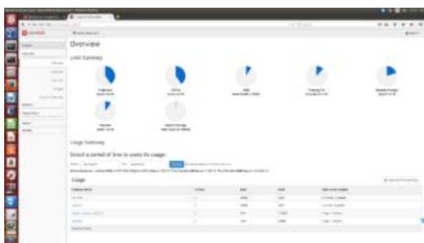
Obrázok 2: Grafický prehľad administrátora pre jednotlivé virtuálne stroje o využívaní zdrojov OpenStacku