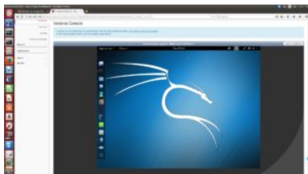
Obrázok 3: Virtuálny stroj s Linuxovou distribúciou Kali Linux pre výučbu predmetu Etický hacking

Obsahom predmetu Etický hacking je objasniť zložitosť a rozsah problému zabezpečenia systémov pre spracovanie údajov a poskytovanie informácií s dôrazom na úlohu manažéra v procese budovania a prevádzkovania takýchto systémov. Po úspešnom absolvovaní budú študenti ovládať základy pre IT bezpečnosť a budú schopní testovať bezpečnosť IS/ICT vo firme, uplatňovať princípy IS/IT informačnej bezpečnosti vo svojej manažérskej činnosti a pôsobiť v rámci systému riadenia informačnej bezpečnosti vo firme, v rôznych fázach vývoja životného cyklu IS/IT vo všetkých manažérskych pozíciách.