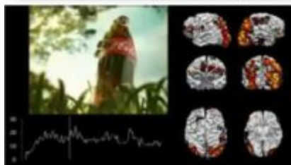
Obrázok č. 8: Časti ľudského mozgu, ktoré ovplyvňujú nákupné správanie