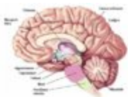
Obrázok č. 7: Štruktúra ľudského mozgu

Ďalšou dôležitou časťou mozgovej kôry je posteriórna oblasť asociácií, ktorá používa informácie získané zo sensorického systému pre vnímanie a jazyk (Du Plessis 2007, s. 43). V hlbšej štruktúre mozgu sa nachádza hipokampus a zaoberá sa aspektmi ukladania do pamäti. V strednom mozgu sa nachádza bazálna uzlina, ktorá pomáha regulovať činnosť motorického systému a limbický systém, ktorý riadi pocity radosti, strachu a bolesti. Niekedy sa nazýva aj „centrum odmeny“ alebo „jašterí“ alebo „plazi“ mozog, pretože ide o primitívnu časť mozgu, ktorá sa vyskytuje u zvierat (aj u plazov). Amygdala je časťou limbického systému a hrá významnú úlohu pri zvládaní úzkostných reakcií človeka (Du Plessis 2007, 43). Hipokampus sa viaže k emocionálnej pamäti a preto si človek emotívne veci zapamätá lepšie. Všetky podnety získané zmyslami z okolia teda prechádzajú dvoma smermi. Jedným je amygdala, ktorá vytvára reakcie na emočnej úrovni a druhým je hipokampus, kde sa odohráva premýšľanie a interpretácia (Du Plessis 2007, s. 67).