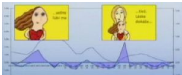
Obrázok č. 9: Graf zmeny vodivosti kože pri spote Dobrý anjel

Úspešným príkladom aplikácie poznatkov do marketingovej praxe v prípade reklamy pre projekt Dobrý anjel bolo meranie zmeny vodivosti kože, ktoré odrážajú zmeny intenzity emócií. Výstupom merania bol graf, ktorého výška hrotov ukazovala, ktorá časť spotu a ako intenzívne zasiahla diváka. Dva najvyššie hroty ukazovali časti reklamy, kde v jednej vyťahuje dievčatko srdiečko a v druhej sa objavuje mamička, ktorá dievčatko objíma a hovorí, že ho ľúbi.