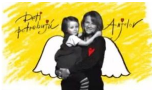
Obrázok č. 10: Druhý spot Dobrý anjel vytvorený na základe poznatkov z predošlého výskumu

Po druhom prezretí reklamy sa graf trochu posunul, najvyššie hroty boli v časti, v ktorej mamička dievčatko objíma a dievčatko spieva „mamičku ľúbim...“ Na základe týchto zistení bol vytvorený nový spot s hercami zdôrazňujúci dotyk, objatie a motív srdca, ktorý priniesol 7 000 nových pravidelných prispievateľov pre Dobrého anjela.